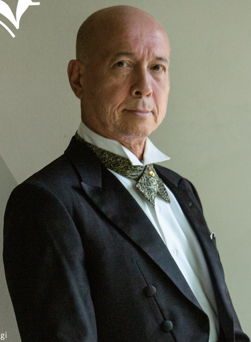
指揮 井上道義 ※